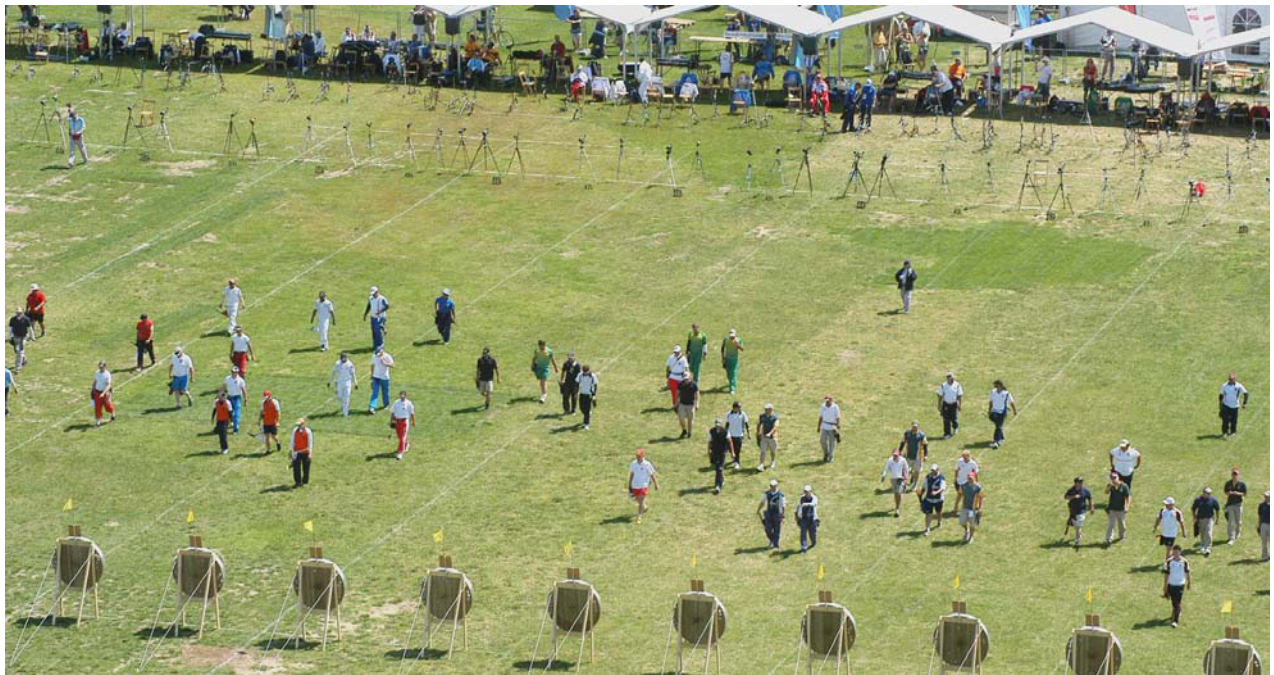
Bild Nr. 1.2.1 Offener Bogenplatz

Liegen mehrere Wettkampfbahnen nebeneinander, haben die seitlichen Abstände und die der Scheiben voneinander mindestens 2 m zu betragen.