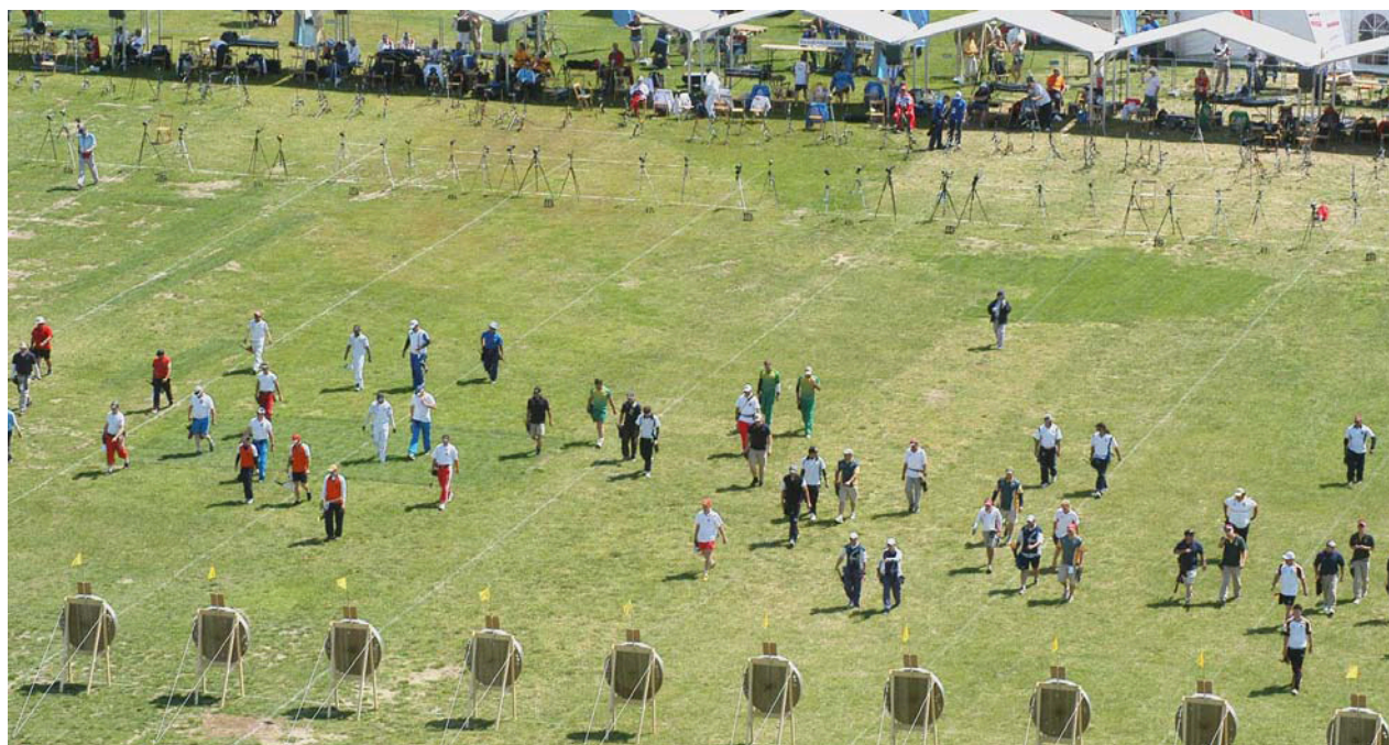
Bild Nr. 1.2.1 Offener Bogenplatz

Liegen mehrere Wettkampfbahnen nebeneinander, haben die seitlichen Abstände und die der Scheiben voneinander mindestens 2 m zu betragen.